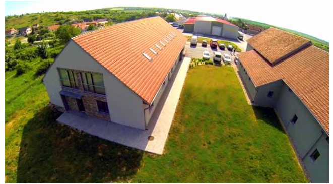
Výrobní haly a administrativní budova firmy LENZA

s námi. S firmou ŠPINAR – software s.r.o. spolupracujeme přes deset let. Spolupráci jsme navázali v oblasti výuky programů TurboCAD a DAEX, propojení dat s CNC a pořádání mezinárodní soutěže „Studentské projekty“, která se v roce 2015 konala na půdě naší školy. Zástupci z praxe se soutěže účastní jako odborní proradci při hodnocení projektů. Díky této akci jsme získali další zajímavé kontakty s uživateli programů, které vyučujeme na naší škole. Perspektivní navázání spolupráce vidíme například se společností Lenza s.r.o., se kterou spolupracujeme v oblasti exkurzí a možném uplatnění našich absolventů v jejich firmě. Spolupracujeme s celou řadou dalších firem, ale zmiňují se o těchto firmách, protože s nimi máme vazby na programy, které jsou tématem našeho rozhovoru.