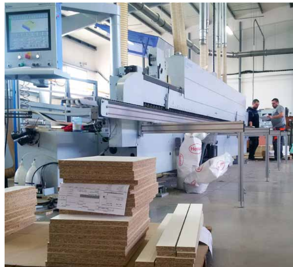
Průvodky pro stejný typ dílů u olepovačky hran

Přiznám se, že sám jsem na začátku nevěděl, do čeho jdeme. Mám ale kolem sebe skvělý tým lidí, se kterým jsme to za těch osm měsíců zvládli.