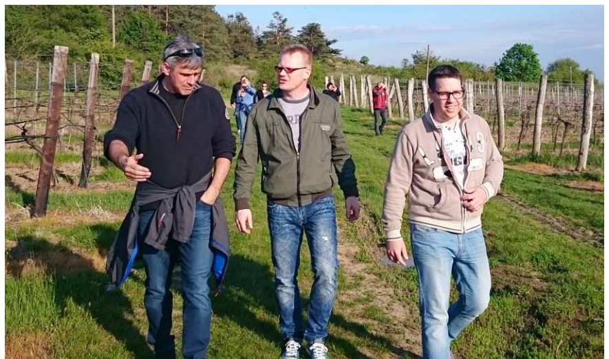
Vize partnerské spolupráce se dá v LENZE řešit i mimo kancelář. Příjemná procházka do vinného sklípku patří k dobrému stylu firmy LENZA