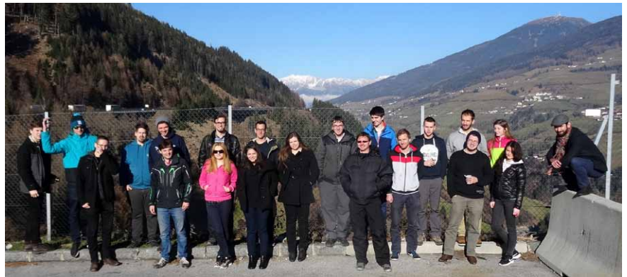
Exkurze studentů České zemědělské univerzity v Itálii a Německu