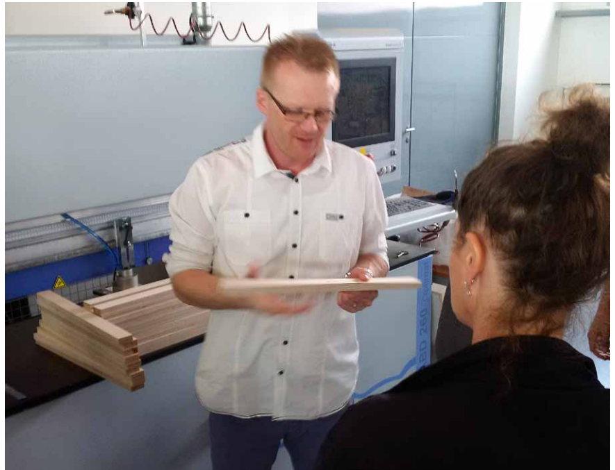
Možnosti exportu dat z DAEXu pro CNC obráběcí centrum nebo vrtací stroj malých dílů

P. S.: Propojení jsou náročná zejména v přípravné části. Musíte si stanovit požadavky na nové fungování systému